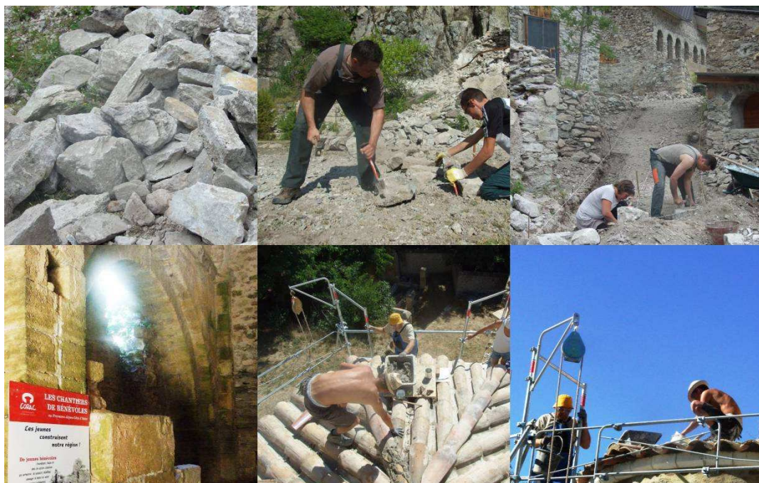
Technique de caladage (Minaire de Vallauria) et Rénovation de toiture d'une chapelle (Miramas) juillet 2009