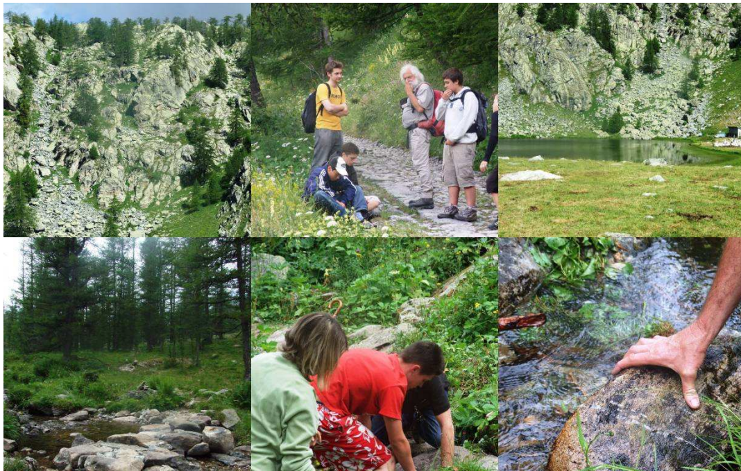
Aménagement d'un sentier de randonnée et découverte de la faune et de la flore du parc national du Mercantour (juillet 2008)